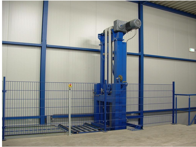
goederenlift, foto van de verdieping