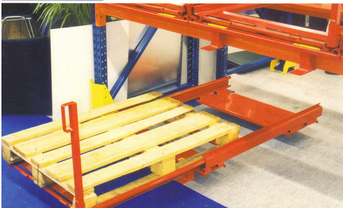
Schuiflade op het grondniveau